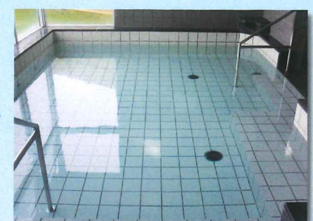
洗浄水排水、湯張り後