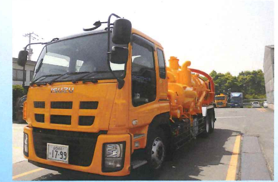
パワープロベスター