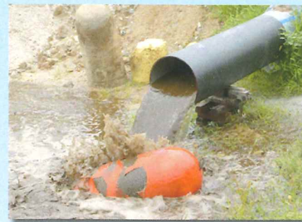
ダクタイル鋳鉄管 600φ×3,500m