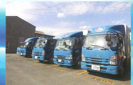
必ず出船駐車です