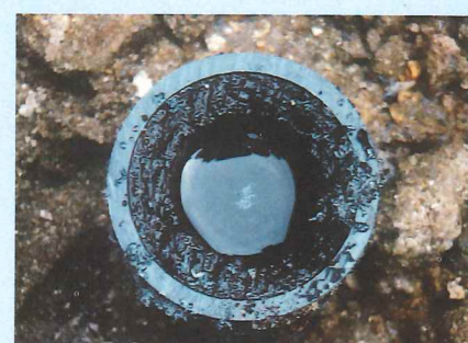
洗浄前マンガン付着状況